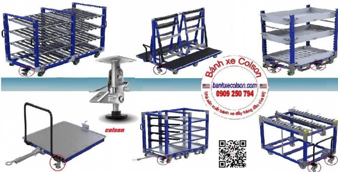
Các vị trí lắp bộ khóa sàn thông dụng

Hotline : 0909 250 794 - Email : nghia.huynh@colsonvietnam.com.vn