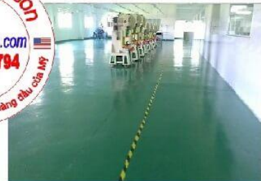
Nhà máy có nền sơn Epoxy