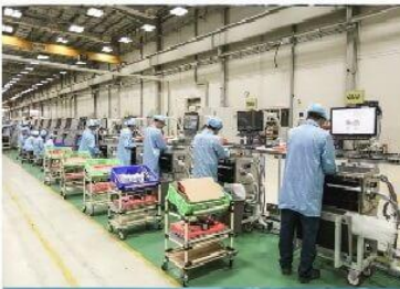
Nhà máy sản xuất