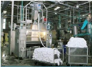
Nhà máy nhuộm