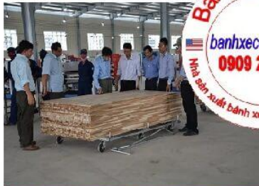
Nhà máy chế biến gỗ