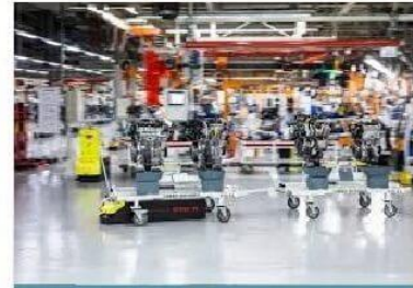
Nâng chuyển hàng hóa