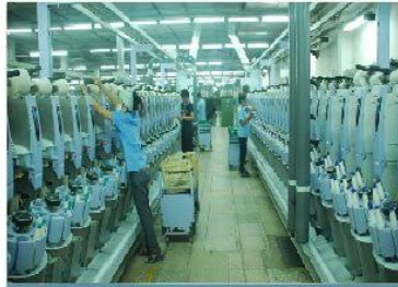
Nhà máy dệt, may mặc