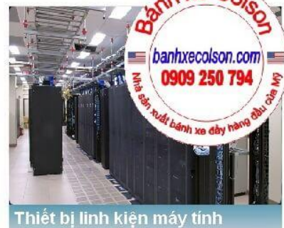
Thiết bị linh kiện máy tính

Hotline : 0909 250 794 - Email : nghia.huynh@colsonvietnam.com.vn Website : https://banhxecolson.com/