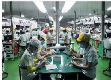
Nhà máy sản xuất linh kiện điện tử