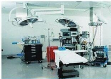
Phòng sạch bệnh viện