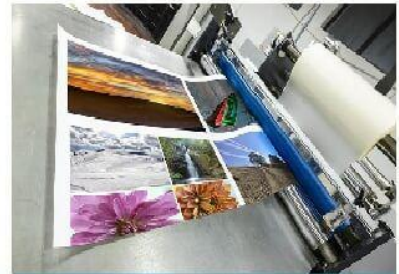
Nhà máy sản xuất phụ tùng in ấn