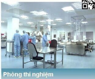
Phòng thí nghiệm