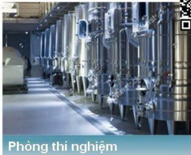
Phòng thí nghiệm