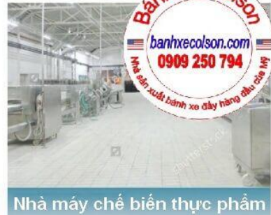
Nhà máy chế biến thực phẩm

Hotline : 0909 250 794 - Email : nghia.huynh@colsonvietnam.com.vn