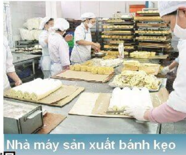
Nhà máy sản xuất bánh kẹo