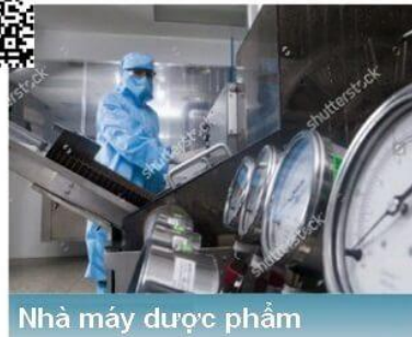
Nhà máy dược phẩm