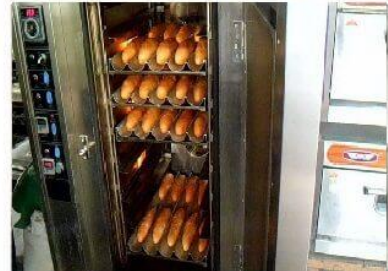
Xe đẩy lò nướng bánh