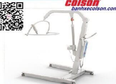
Thiết bị vật lý trị liệu

Hotline : 0909 250 794 - Email : nghia.huynh@colsonvietnam.com.vn