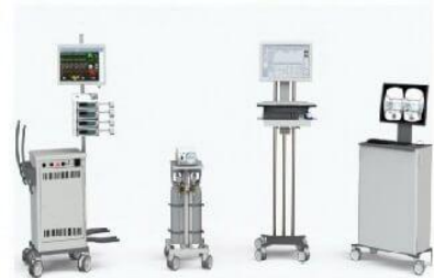
Thiết bị chẩn đoán y khoa