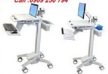
Xe đẩy thiết bị điện tử