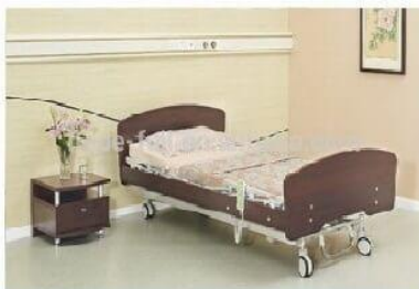
Giường y tế bệnh nhân