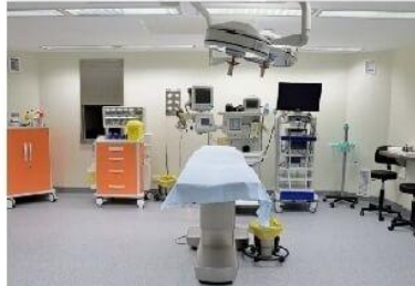
Thiết bị sơ cấp cứu